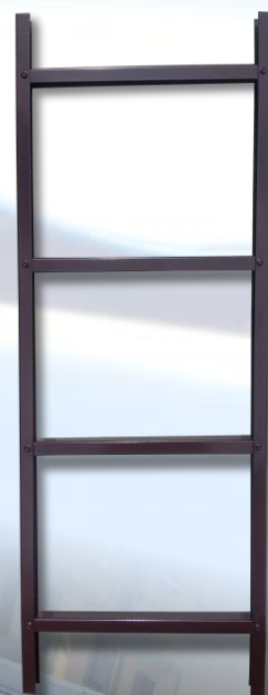
Kopėčios 1,25 m

Kopėčių atramos viena linija išdėstomas kas 1,0m-1,20m ir varžtais arba sraigtais tvirtinamos prie stogo konstrukcijų. Kai montuojama ant molio ar betono čerpių naudojami papildomi laikikliai, taip pat tenka sumontuoti papildomus grebėstus. Kiaurymės varžtams sandarinamos gumine tarpine, dedama tarp atraminės plokštelės ir stogo dangos, ir hermetikais.