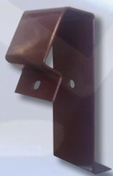
Kopėčių laikiklis universalus, koja